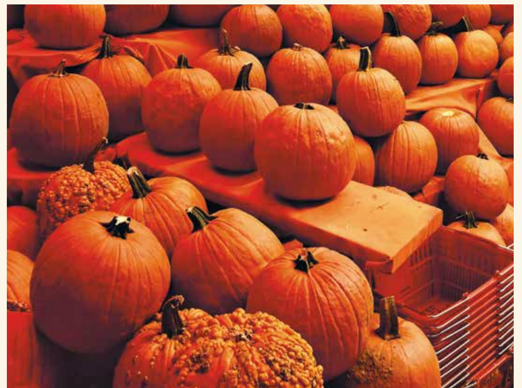
看到一堆堆的南瓜，就知道万圣节快到。很多纽约人会以南瓜制成南瓜灯，摆放在家里。